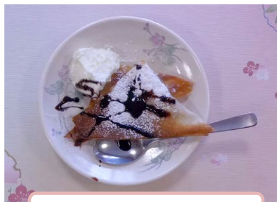
皆さまの手作りデザート